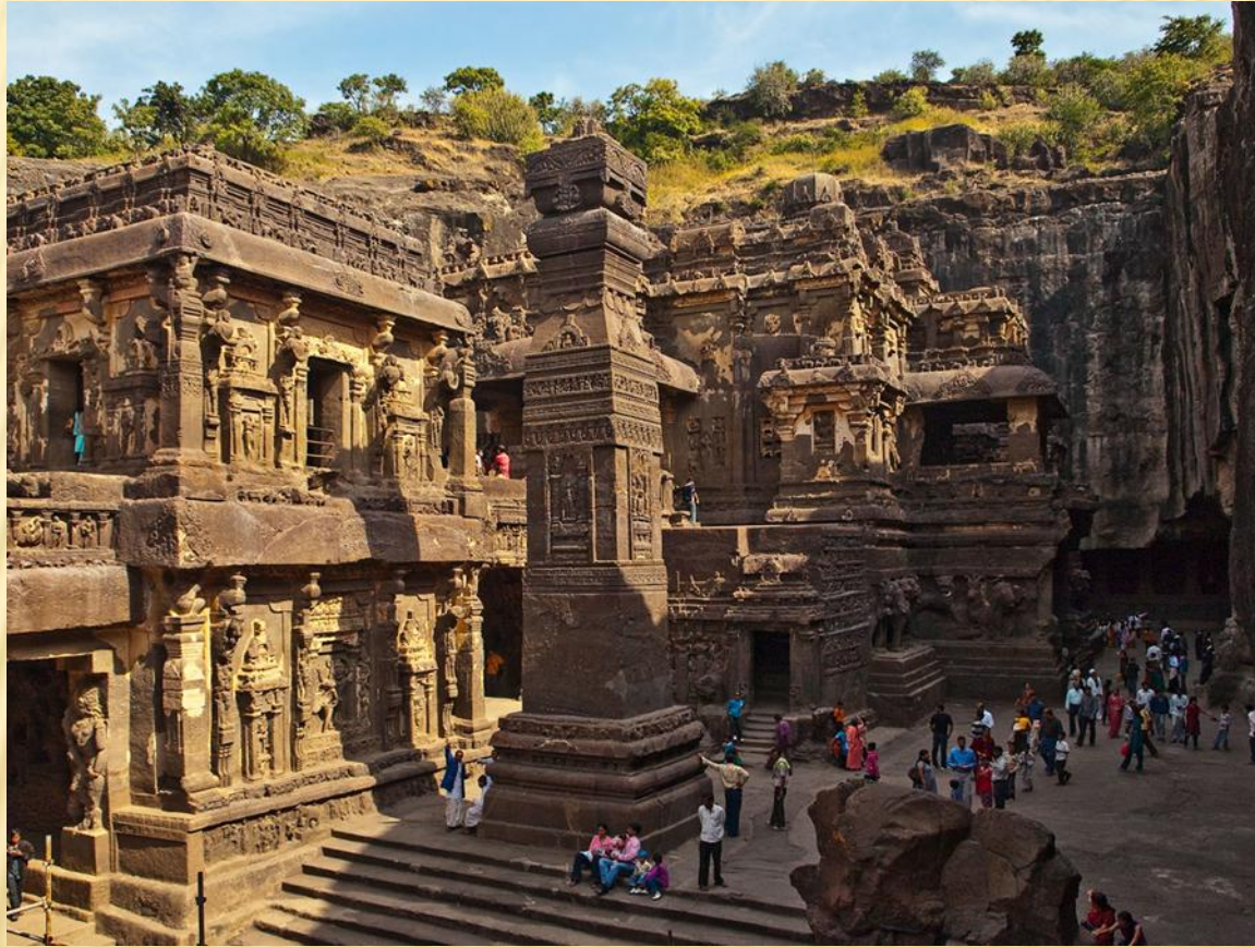
The ELORA caves in India